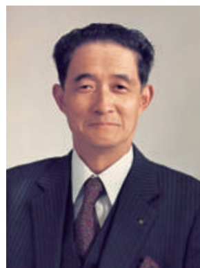
麗澤海外開発協会 初代会長